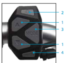
Bedieningselement van centerdisplay